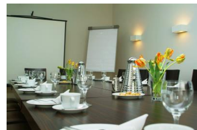
Blockfish für 10 Personen