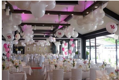
Tischtafeln mit Mittelgang