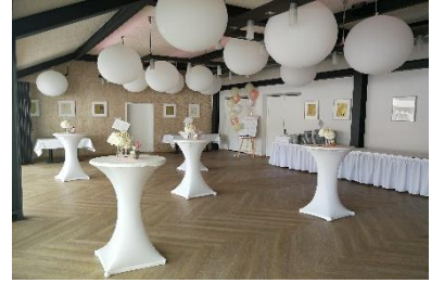
Empfangs- & Buffetraum später Tanzfläche