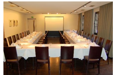
U-Form bis maximal 42 Personen (innen & außen bestuhlt)