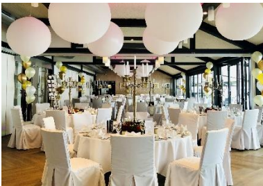
Runde Tische à 9 Personen