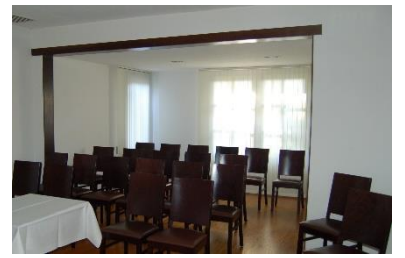
Stuhlreihen bis maximal 20 Personen