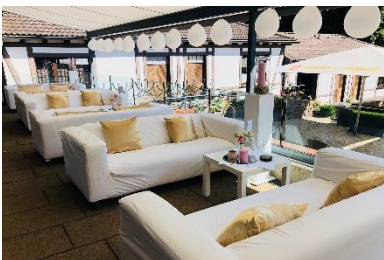
Terrasse I & II mit Sofas