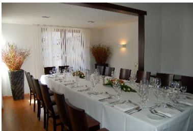
Tischtafel bis maximal 16 Personen