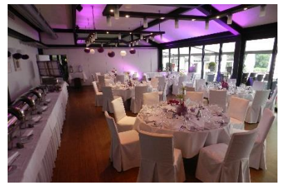
Runde Tische bis max. 54 Personen