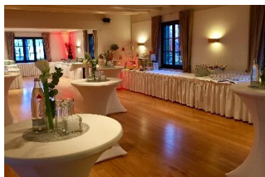
Empfangs- & Buffetraum