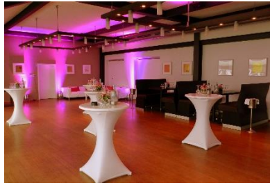
Restaurant II mit lockerer Bestuhlung