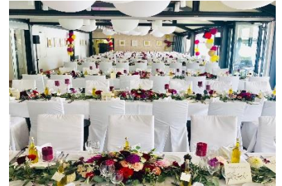
Lange schmale Tischtafeln je Tafel 16 P.