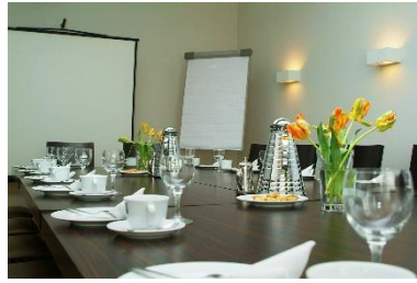
Blockfisch für 10 Personen