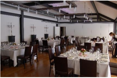
maximal 6 x Blocktische mit 8 Personen