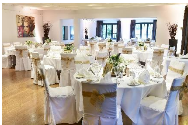
Runde- & ovale Tische bis maximal 105 Personen