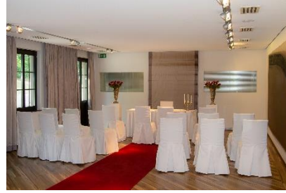
Freie Trauung bis maximal 50 P. stehend