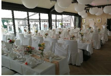
5 x lange Tischtafeln bis maximal 70 Personen