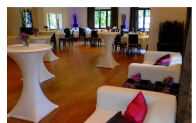
Stehische, Sofas, Buffet, 5 x runde Tische