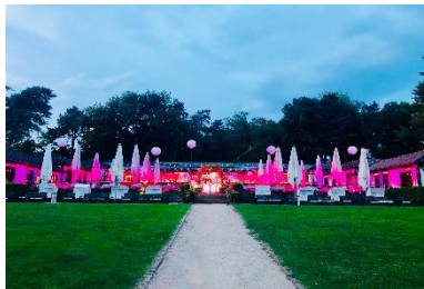
Außen-Aufnahme Wiese & Biergarten