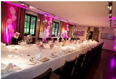
Lange breite Tischtafel bis maximal 36 Personen