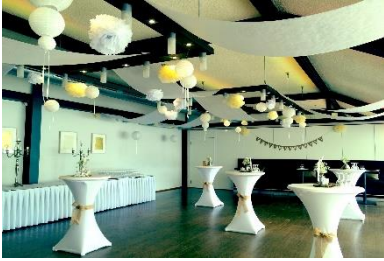
Restaurant II mit Buffet und Hochbänken