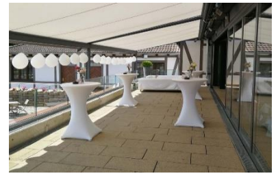
Terrasse I & II mit Stehtischen & Sofas